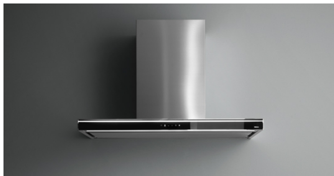
De foto is puur informatief Kan afwijken van de geselecteerde versie.