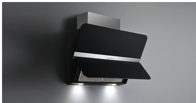
De foto is puur informatief Kan afwijken van de geselecteerde versie.