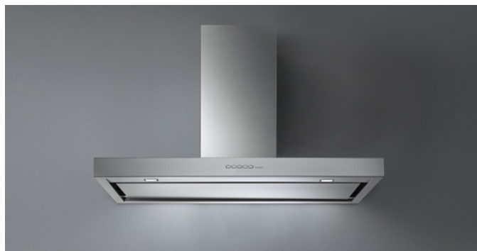
De foto is puur informatief Kan afwijken van de geselecteerde versie.