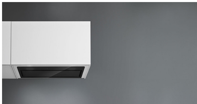
De foto is puur informatief Kan afwijken van de geselecteerde versie.