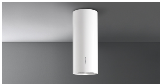
De foto is puur informatief Kan afwijken van de geselecteerde versie.